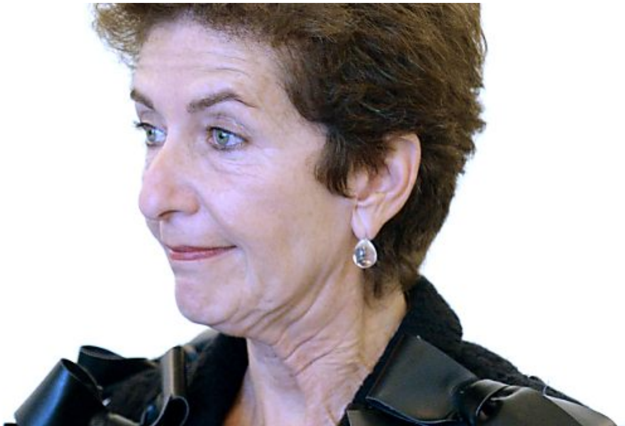
Regisseurin Beckermann dokumentierte die Causa Waldheim

17.02.2018 19:31 (Akt. 17.02.2018 19:50)